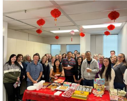
Les membres de l'équipe du bureau de Calgary qui célèbrent la Fête de la mi-automne 2023 avec un repas-partage.

Elle remonte à l'époque où les empereurs chinois vénéraient la lune et utilisaient la prière pour assurer des récoltes abondantes, un temps clément et la paix dans tout le pays. Comme la récolte est liée au cycle lunaire, la fête a lieu pendant une pleine lune. Les rituels et festivités entourant la Fête de la mi-automne varient d'une communauté à l'autre et peuvent inclure des gâteaux de lune symbolisant l'harmonie et l'unité, des lanternes représentant la chance et des séances d'observation de la Lune. La Fête de la mi-automne est aussi connue sous les noms de « fête de la Lune », « fête de la lune d'automne », « fête des gâteaux de lune », « fête des retrouvailles » et « Zhōngqiū jié » (中秋节).