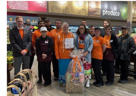
Le magasin Safeway City Centre de Thompson, au Manitoba, marque la Journée du chandail orange 2023 en faisant un don de 2 000 $ au centre d'amitié Ma-Mow-We-Tak.

Équipes de vente au détail : Pendant les jours importants pour la communauté, nous vous demandons de vous abstenir de créer ou d'offrir des produits à vendre dans le rayon de la boulangerie ou dans d'autres rayons.