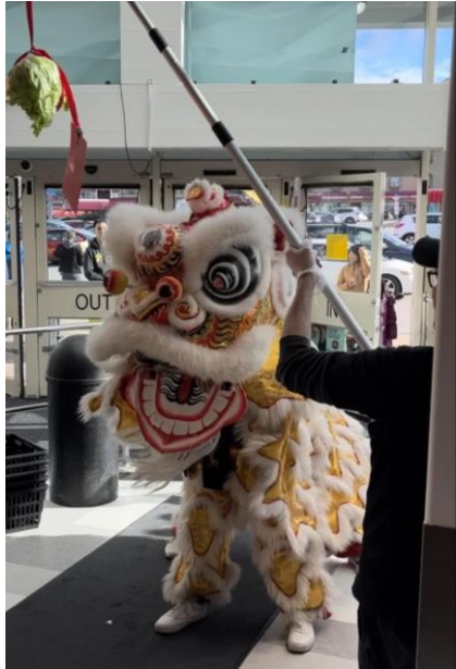
Danse du lion au Collingwood Safeway, Vancouver, CB