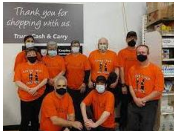
Cash & Carry, Sobeys Ventes en gros – Truro Sept. 2021

Nous demandons aux équipes de ne pas offrir / créer des articles à vendre dans le département de la boulangerie ou dans d'autres départements.